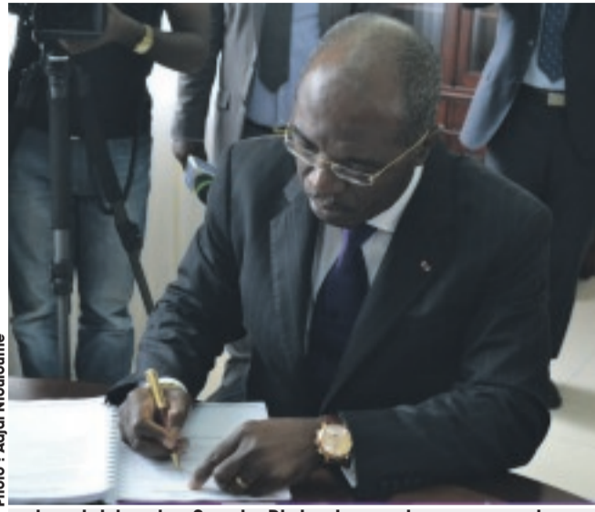
le ministre des Sports, Blaise Louembe apposant sa signature.