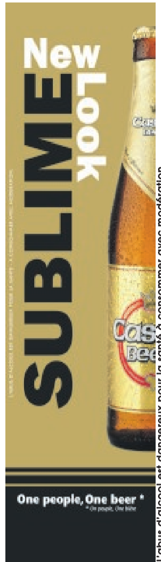
L'abus d'alcool est dangereux pour la santé à consommer avec modération