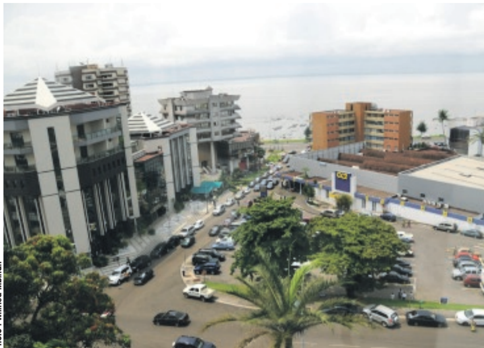
Le Gabon est monté à la 23e place du classement. Soit 4 places de mieux qu'en 2014.

catégories. Il s'agit de la Côte d'Ivoire, du Maroc, du Rwanda, du Sénégal, de la Somalie et du Zimbabwe. « Bien que, dans l'ensemble, nos concitoyens africains sont certainement en meilleure santé et vivent dans des sociétés plus démocratiques qu'il y a 15 ans, le rapport 2015 montre que l'évolution récente sur le continent dans d'autres domaines clés est, soit au point mort, soit en déclin, et que certains pays majeurs semblent marquer le pas », estime le président de la Fondation Mo Ibrahim. On retrouve en tête de classement, par ordre, l'Ile Maurice, le Cap vert, le Botswana, l'Afrique du Sud, la Namibie, les Seychelles, le Ghana, la Tunisie, le Sénégal et le Lesotho.