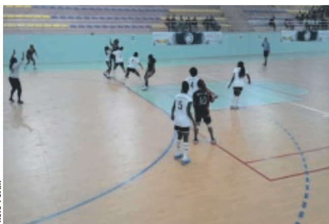
Une phase de la rencontre Phoenix-Nairobi Water remportée par les Gabonaises (36-28).