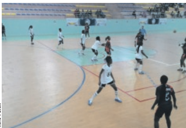
Match chez les Dames : Phoenix du Gabon (noir) face à Nairobi Water du Kenya.