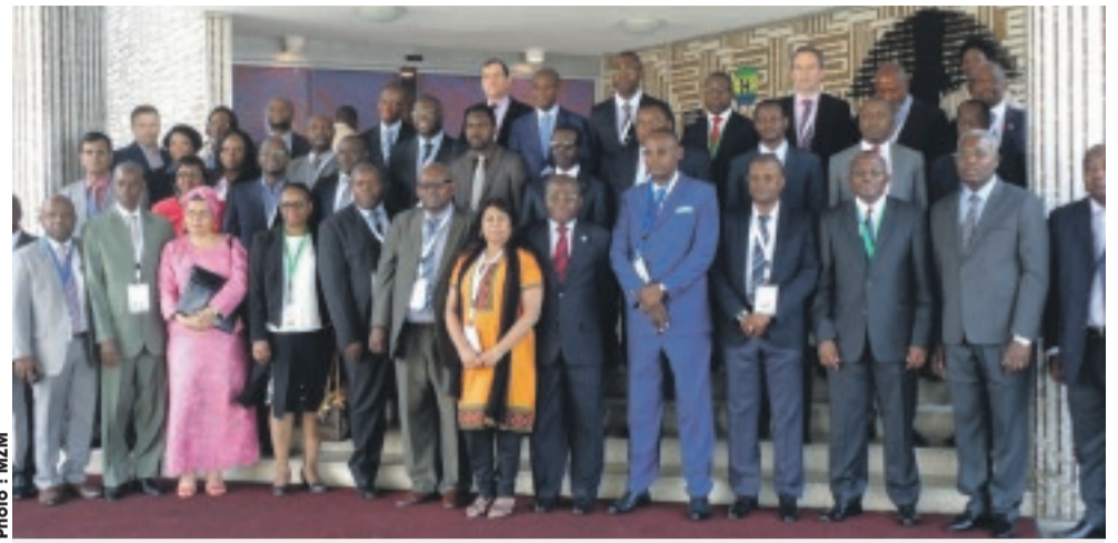
Photo de famille des experts douaniers