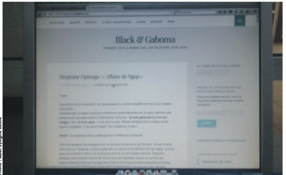
Ici, un blog culturel gabonais.