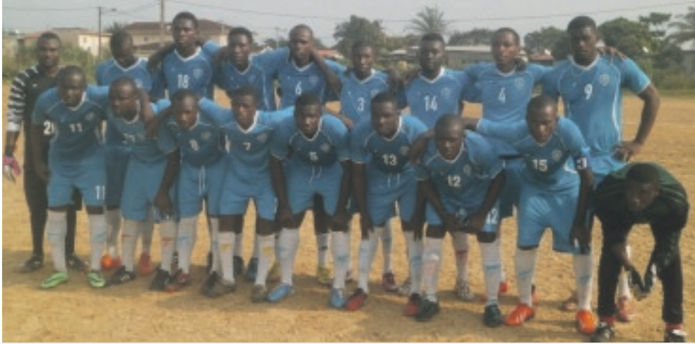
L'équipe de Ndzimba FC a été battue par Badji FC.