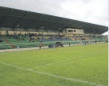
Le stade Monedan, théâtre d'accrochages entre portiers et représentants de médias.

Frictions entre portiers et hommes des médias au stade