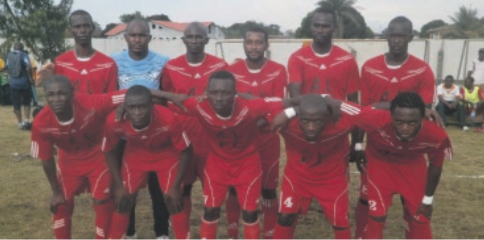
ADL a perdu par forfait pour manque de maîtrise du calendrier du championnat.