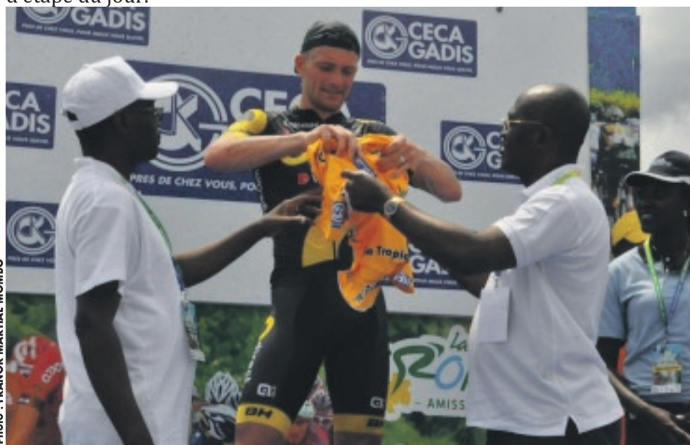
... qui reçoit le maillot du vainqueur de l'étape.