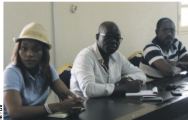
... membres du bureau.

éviter surtout de surclasser les cadets notamment. Il faut être méticuleux dans l'application des textes. Pas question de brûler les étapes aux jeunes joueurs au moment où le Gabon va organiser la Can 2018. Par