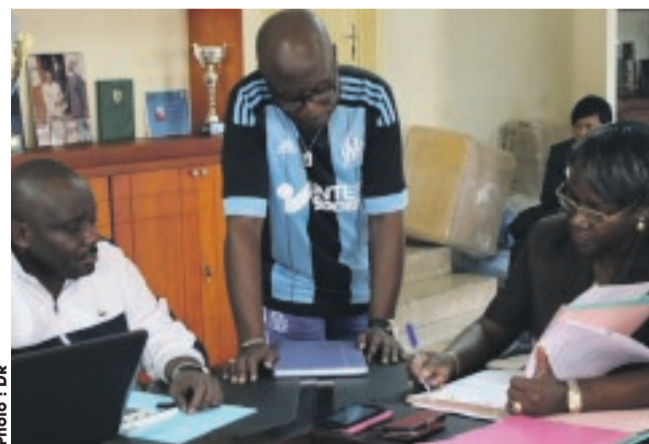
La présidente fédérale (à droite) signant les documents statutaires de la Lineph.

ailleurs, la subvention de l'État, déjà disponible, ne sera donnée qu'en fonction du nombre réel des joueurs licenciés par clubs. L'État vous accompagne, à vous de trouver d'autres solutions auprès des sponsors », a in-