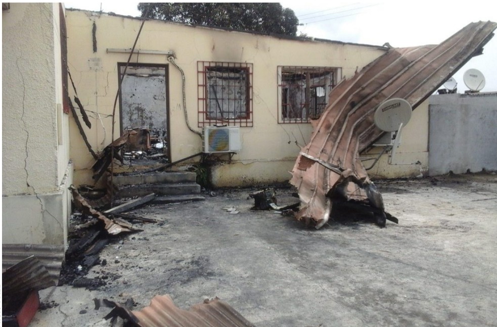
L'arrière de l'édifice : rien n'y a pu être récupéré.