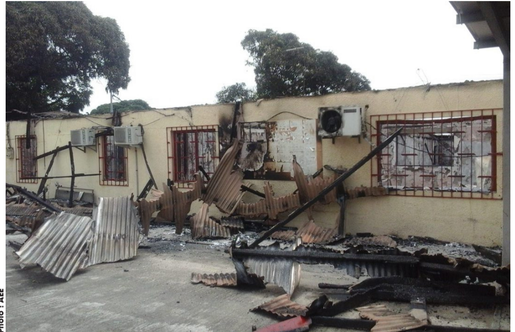
Ce qui reste du bâtiment après le passage des flammes.