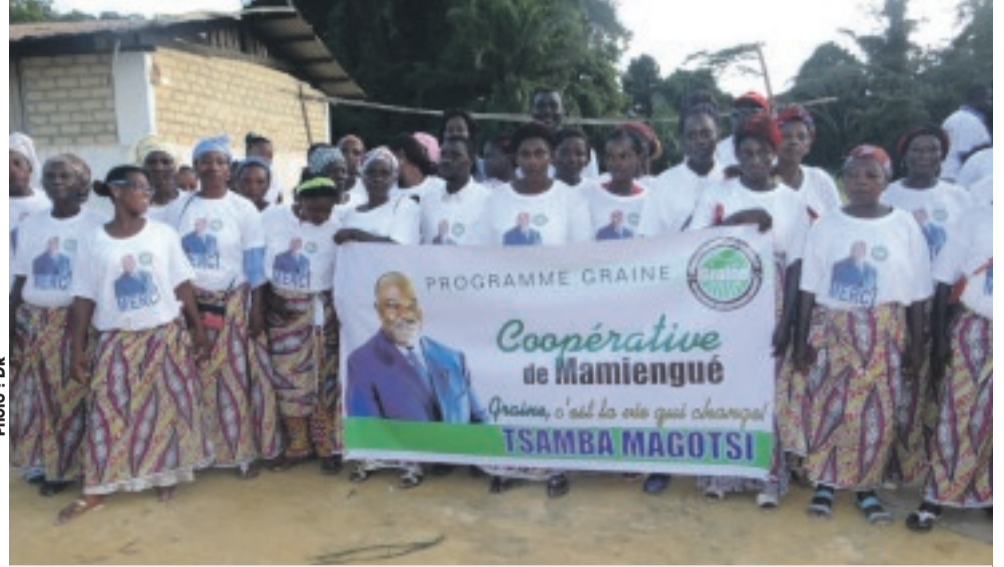
Les membres de la nouvelle coopérative au grand complet.