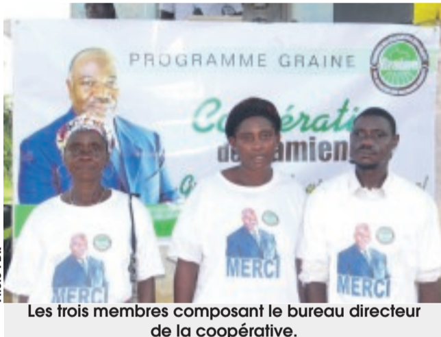
Les trois membres composant le bureau directeur de la coopérative.