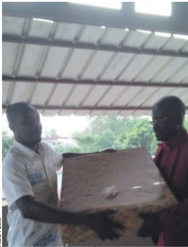
Une vue partielle des présents remis aux retraités par leur syndicat.