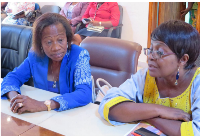
Deux femmes faisant partie de la caravane.