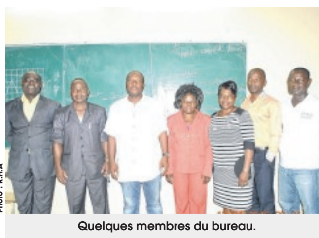
Quelques membres du bureau.

Adzap-Nye, le Cercle Odock se définit comme une plate-forme destinée au développement communautaire des villages cités plus hauts. Pour atteindre cet objectif, l'organisation entend mettre en œuvre des projets de développement et promouvoir l'entrepreneuriat, notamment avec les activités génératrices de revenus. Selon les indications du bureau, cette association se veut également être le