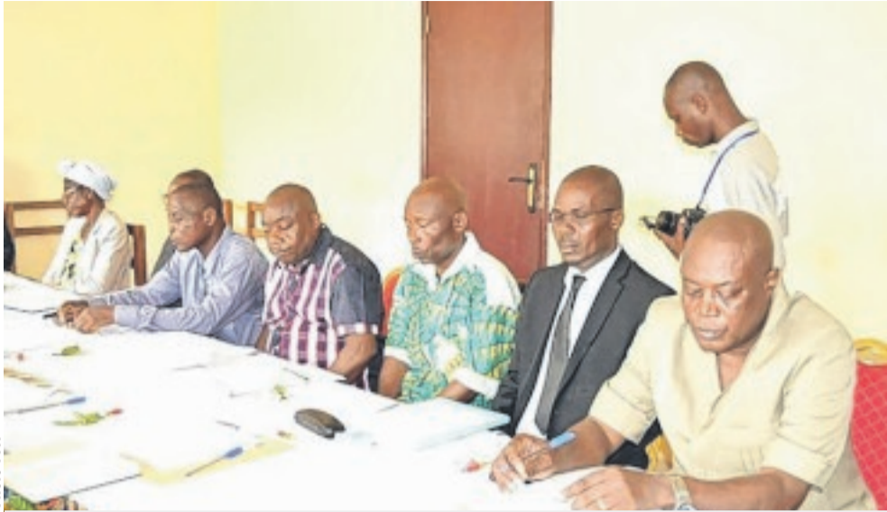
Les conseillers départementaux ont...