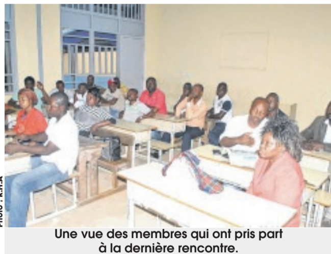
Une vue des membres qui ont pris part à la dernière rencontre.

Adzap-Nye, le Cercle Odock se définit comme une plate-forme destinée au développement communautaire des villages cités plus hauts. Pour atteindre cet objectif, l'organisation entend mettre en œuvre des projets de développement et promouvoir l'entrepreneuriat, notamment avec les activités génératrices de revenus. Selon les indications du bureau, cette association se veut également être le