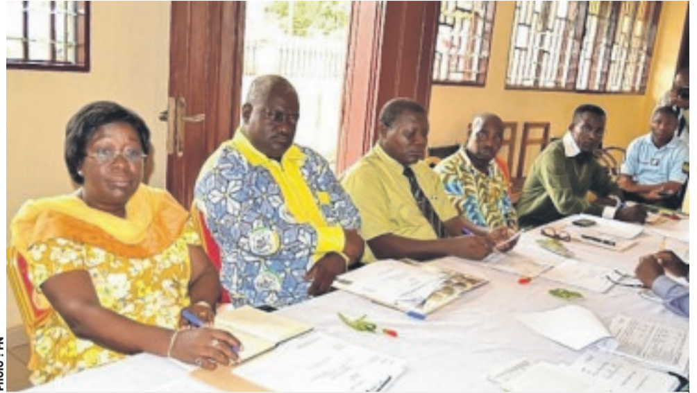
... examiné avec un grand intérêt le budget primitif 2016 de leur institution.