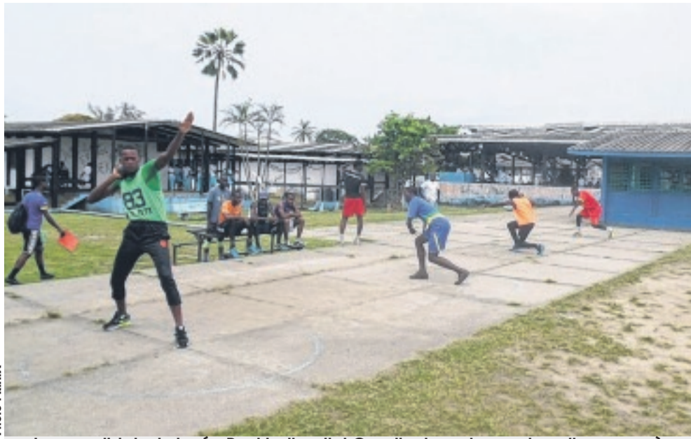
Les candidats du lycée Paul Indjendjet Gondjout, un des centres d'examen, à l'épreuve du lancer.

LES épreuves sportives du baccalauréat, session 2016, ont démarré hier sur toute l'étendue du territoire national. Tous les grands centres d'examen de la capitale et