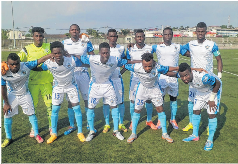
L'A.O CMS termine la saison à la 7e place.

SI les rencontres entre le FC 105/USO et Stade Migovéen/Nguen'Asuku étaient des matches couperets, pour la lutte au maintien, cela n'a nullement été la cas en ce qui concerne celle qui a mis aux prises l'A.O CMS et Missile FC. Seul enjeu: figurer le plus haut possible au classement, vu que les deux équipes étaient déjà assurées d'évoluer la sai-