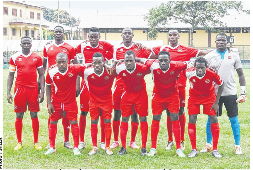
Malgré la défaite, Missile FC est resté à la 5e place à l'issue de la 26e journée.