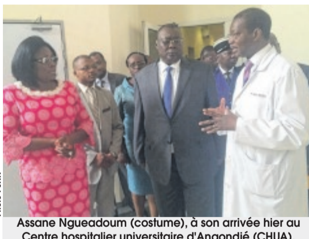
L'émissaire de l'OMS-Afrique s'imprégnant du fonctionnement des différents services du CHUA.