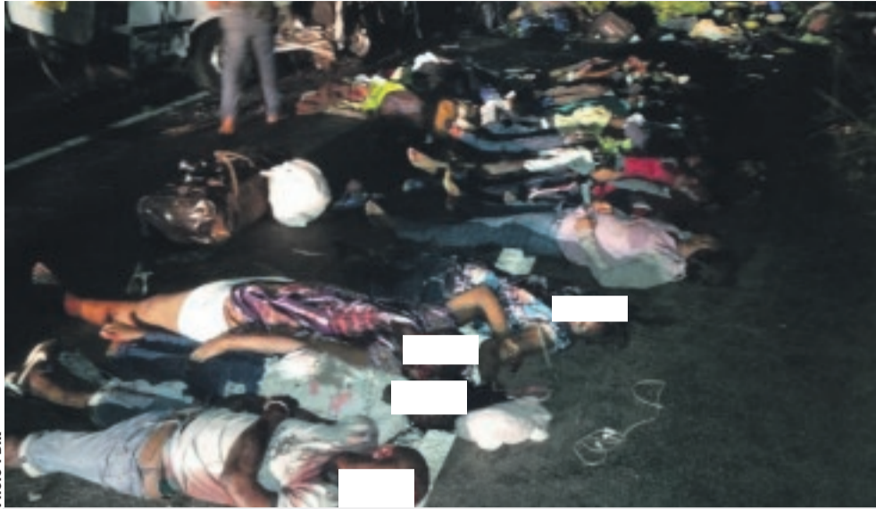
Les 14 morts sur-le-champ après l'impact.