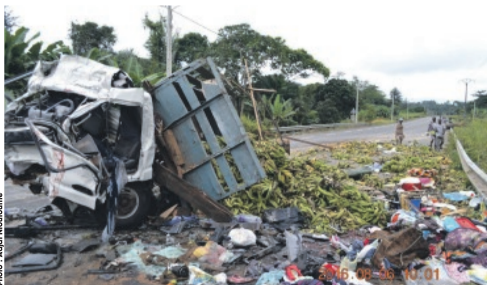
... avec le Canter transportant de la banane.