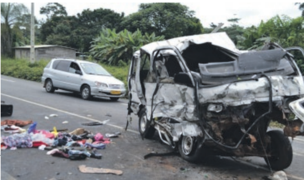
Le minibus suburbain après le choc...