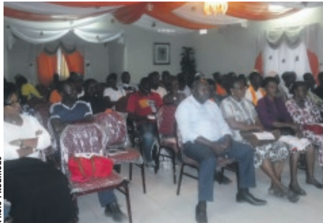
... les responsables des cellules...