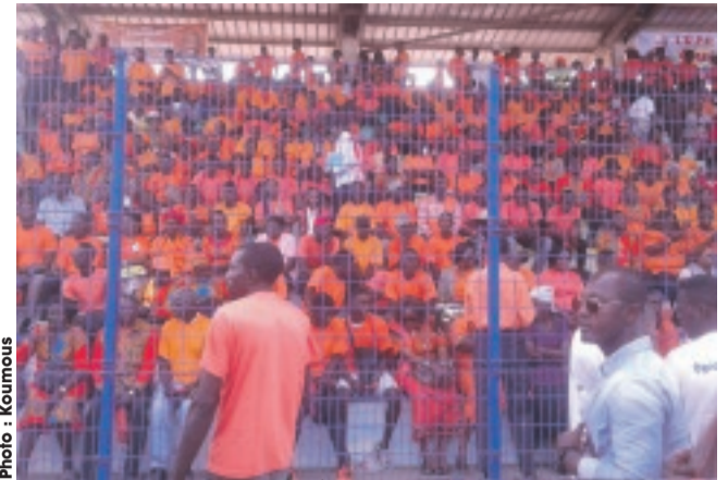
... et les militants à mener une campagne responsable.