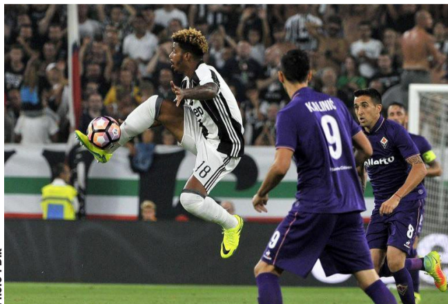
En ouverture de la Série A contre la Fiorentina, Mario Lemina a encore marqué des points.