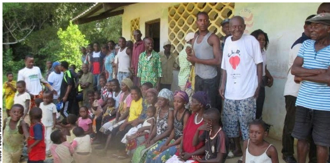
L'équipe du WCS échangeant avec la communauté de Loa-Loa sur les AGR à Makokou.

organisations de la société civile, le secteur privé et les populations vivantes en périphérie de ses aires protégées, comme une solution aux difficultés plurielles de la gestion des ressources naturelles. Ainsi, le CCGL, dans sa démarche, intervient pour avis en qualité de conseil économique, social, culturel et environnemental. Il doit permettre une gestion participative et concertée entre les différentes parties prenantes du parc national. Mais également participer à la mise en œuvre du nouveau Pacte social prôné par le gouvernement, en vue de lutter contre la pauvreté.