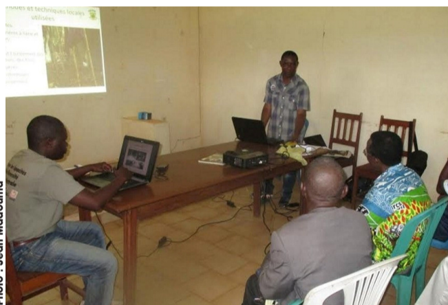
... puis avec les responsables des administrations de Minvoul. Photo de droite : La sensibilisation des communautés de Minvoul par le WCS en vue de la mise en place les activités génératrices de revenus.