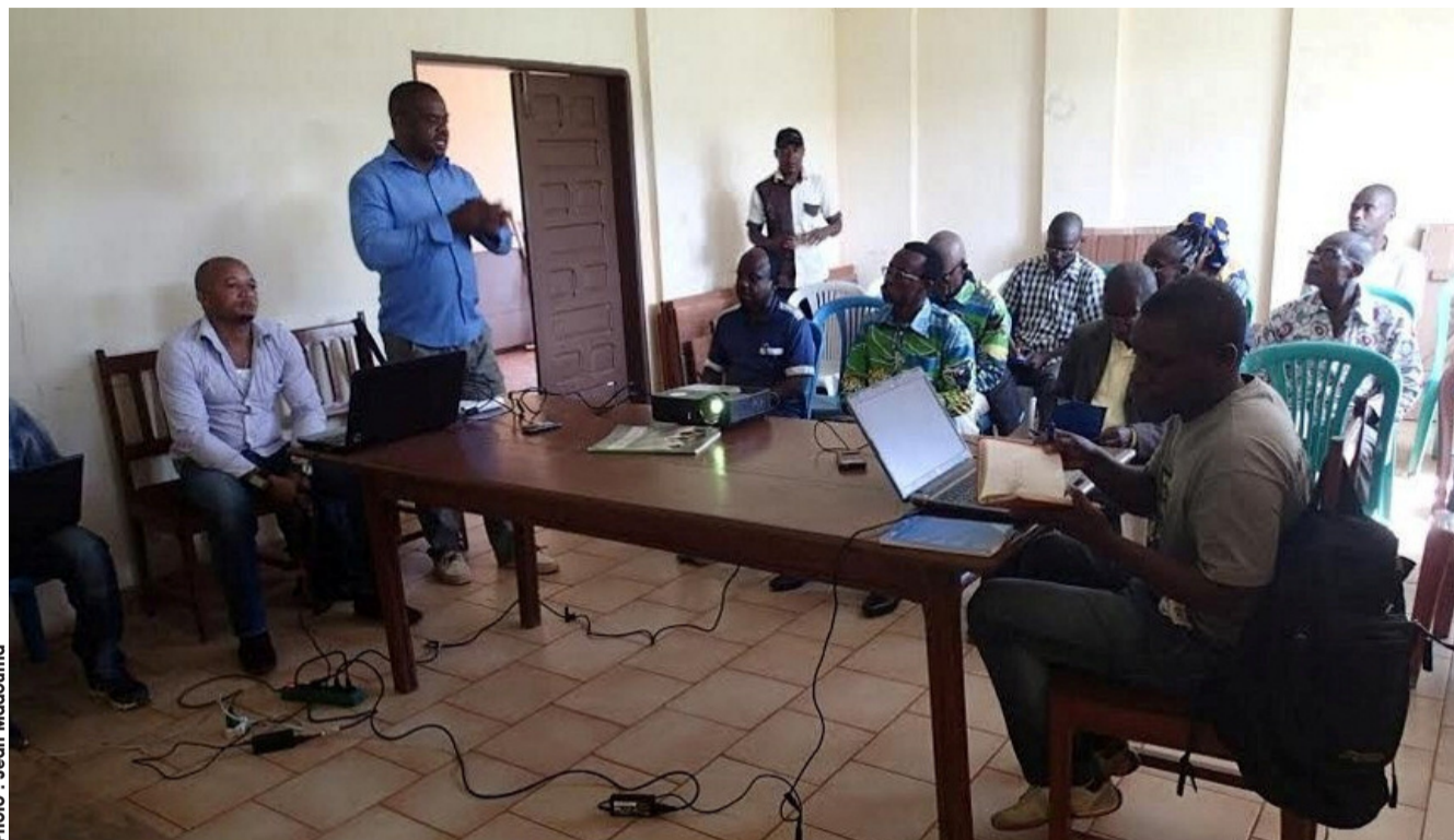
L'équipe du WCS au contact des communautés de Mékambo...