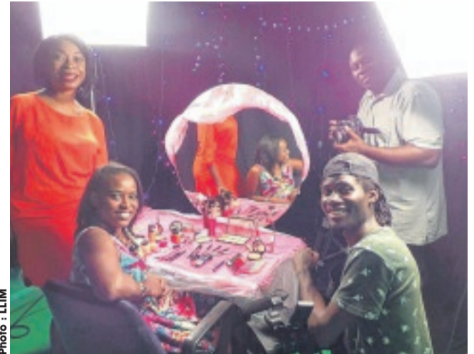
Une équipe technique en plein tournage d'émission.