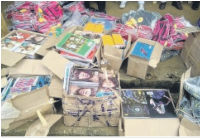
Une partie des kits scolaires remis.