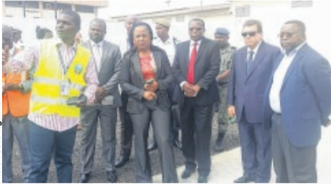
La ministre des Transports, Flavienne Mfoumou Ondo (c) a visité...