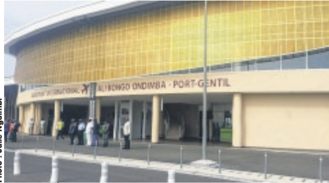
... l'aéroport international Ali Bongo Ondimba de Port-Gentil.