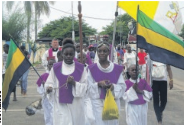
La procession des fidèles chrétiens, à l'occasion de la célébration de la fête des saints innocents...

MERCREDI dernier, le diocèse de Port-Gentil a célébré la fête des saints innocents. Pour magnifier ces instants, une procession des fidèles chrétiens s'est déroulée à travers les artères de la capitale économique avec, comme point de départ, la clinique Saint-Pierre, sur le boulevard Léon-Mba. Une marche en mémoire de tous les saints innocents, victimes des avortements et des crimes rituels. La chorale diocésaine et de nombreux fidèles ont pris part à cette marche funè-