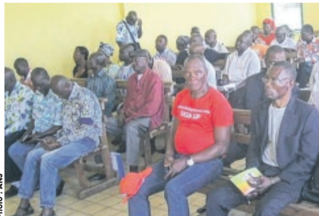
Des militants du PDG suivant la restitution des travaux.

d'adhérents dans la "maison". Il conviendra de souligner, à cet égard, que chaque militant a été exhorté à fournir des efforts supplémentaires dans son milieu, pour atteindre cet idéal. Mais au-delà de tout, la situation politique du PDG dans le canton Ellelem a suscité de nombreux débats qui se sont déroulés dans la convivialité. Même, il est vrai, si les participants y ont relevé des maux qui minent le bon fonctionnement du parti. Au nombre de ceux-ci, la duplicité qui s'est manifestée d'une manière fla-