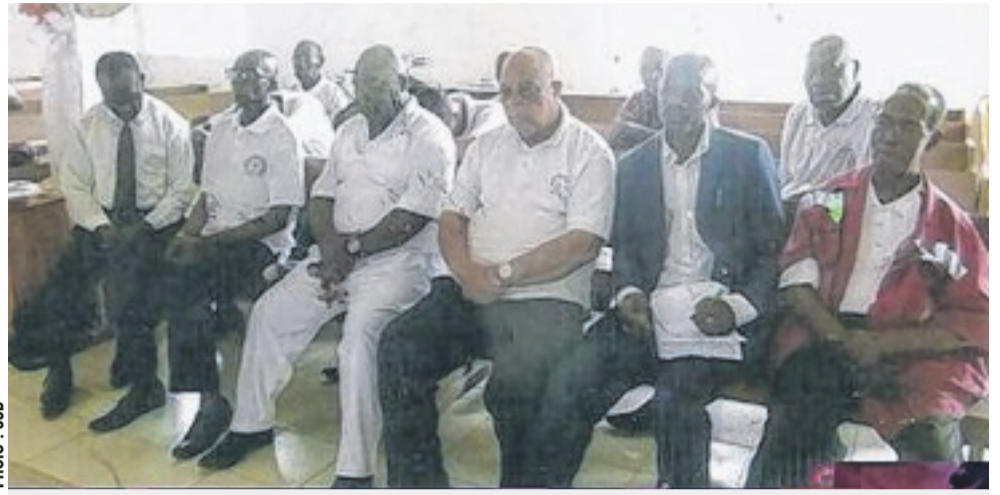
Quelques responsables de l'Eglise.