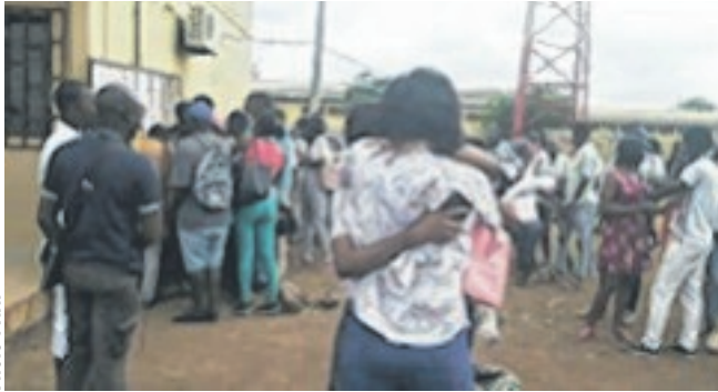
Scène de joie entre candidats ayant su tirer leur épingle du jeu...