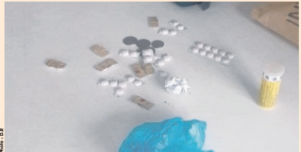
Quelques médicaments détournés de leur usage (kobolo) saisis chez des élèves dans un établissement secondaire de Libreville.

Accessible à des prix dérisoires - l'on parle de 250 F le comprimé -, le "Kobolo" s'est taillé une place de choix dans les conversations, en milieu jeune notamment. Mais ces produits ont également été le catalyseur de bien de drames dans les préaux et cours de récréation de nos écoles.