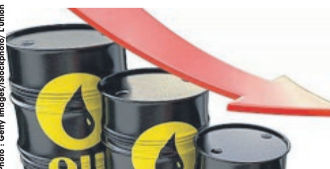
La production pétrolière du Gabon a reculé de 7,7 % lors des neuf premiers mois de l'année 2017 par rapport à la même période de 2016.