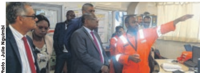
Le gouverneur de l'Ogooué-Maritime Patrice Ontina suivant les explications d'un ingénieur sur le fonctionnement du Terminal.