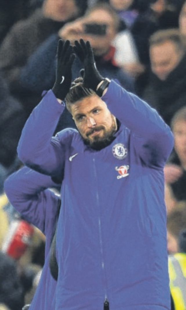
Olivier Giroud désormais sous les couleurs de Chelsea.