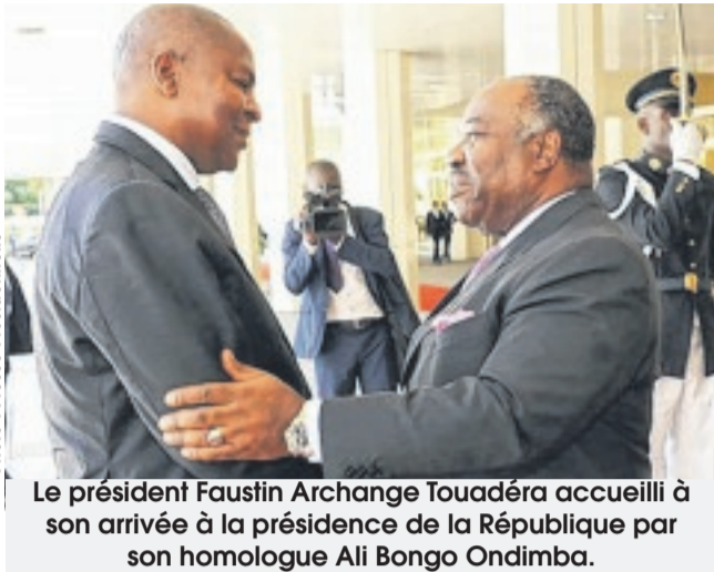
Le président Faustin Archange Touadéra accueilli à son arrivée à la présidence de la République par son homologue Ali Bongo Ondimba.