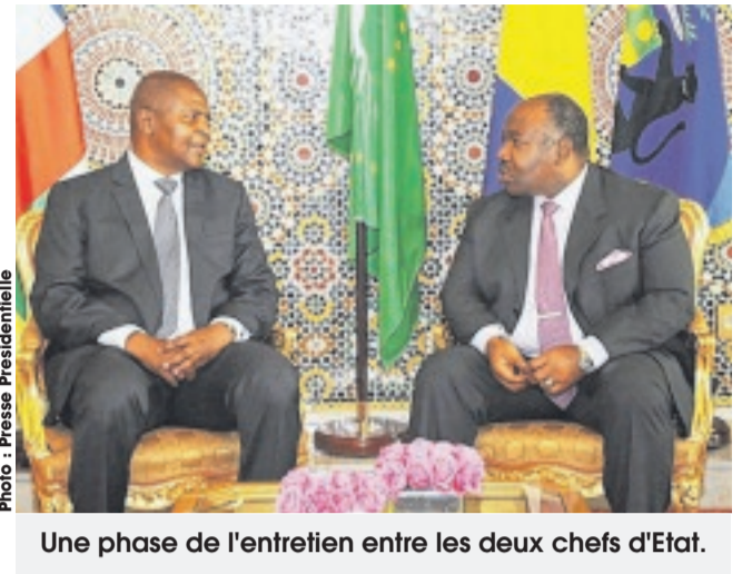
Une phase de l'entretien entre les deux chefs d'Etat.