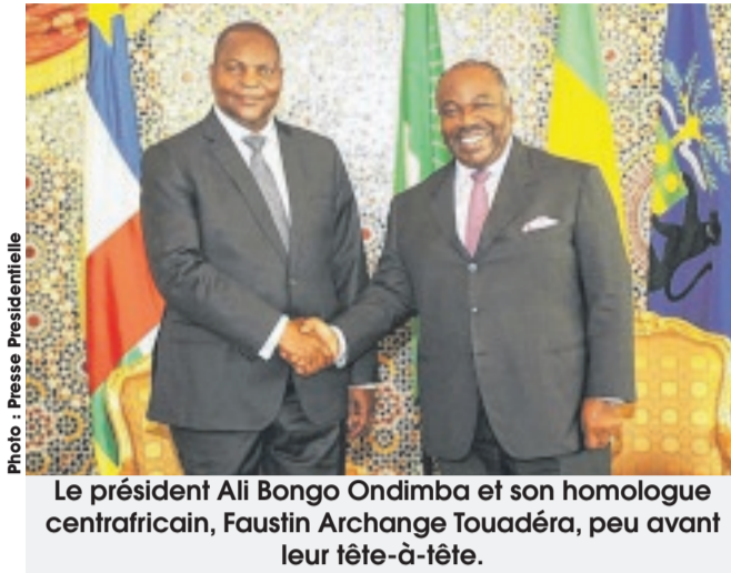
Le président Ali Bongo Ondimba et son homologue centrafricain, Faustin Archange Touadéra, peu avant leur tête-à-tête.