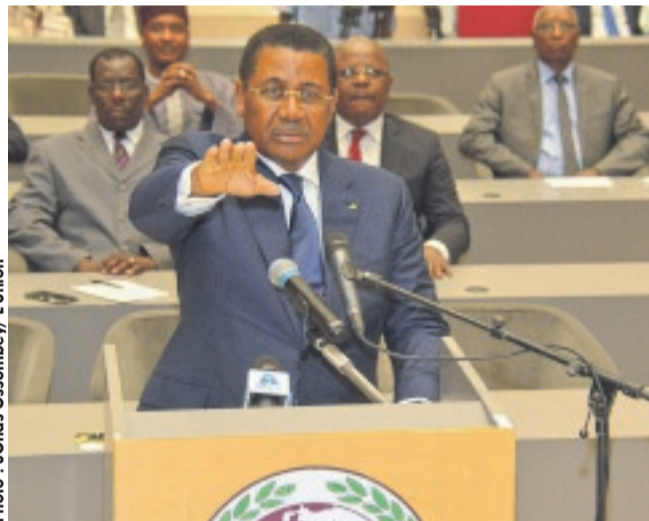
Le président de la commission de la Cémac, lors de sa prestation de serment.

DEVANT le Parlement communautaire basé à Malabo en Guinée équatoriale, Daniel Ona Ondo, le président de la Commission de la Communauté économique et monétaire de l'Afrique centrale (Cémac) a décliné son programme d'action. Nouvellement porté à la tête de cette instance, l'ancien Premier ministre gabonais aura, pendant cinq ans, certaines "priorités" à réaliser. En clair, Ona Ondo a indiqué que le leitmotiv de son mandat à la tête de la Commission sera de repenser la gouvernance et surtout rendre plus efficaces nos interventions communautaires pour accélérer l'intégration régionale. Outre cette ambition, l'action de la Commission de la Cémac s'appuiera sur deux principales missions du Plan opérationnel 2017-2021, autour duquel cinq axes majeurs sont définis, notamment le développement des échanges commerciaux intracommunautaires ; l'encouragement des Etats dans les réformes sectorielles pour améliorer l'offre d'énergie ; la mise en place et le développement des infra-