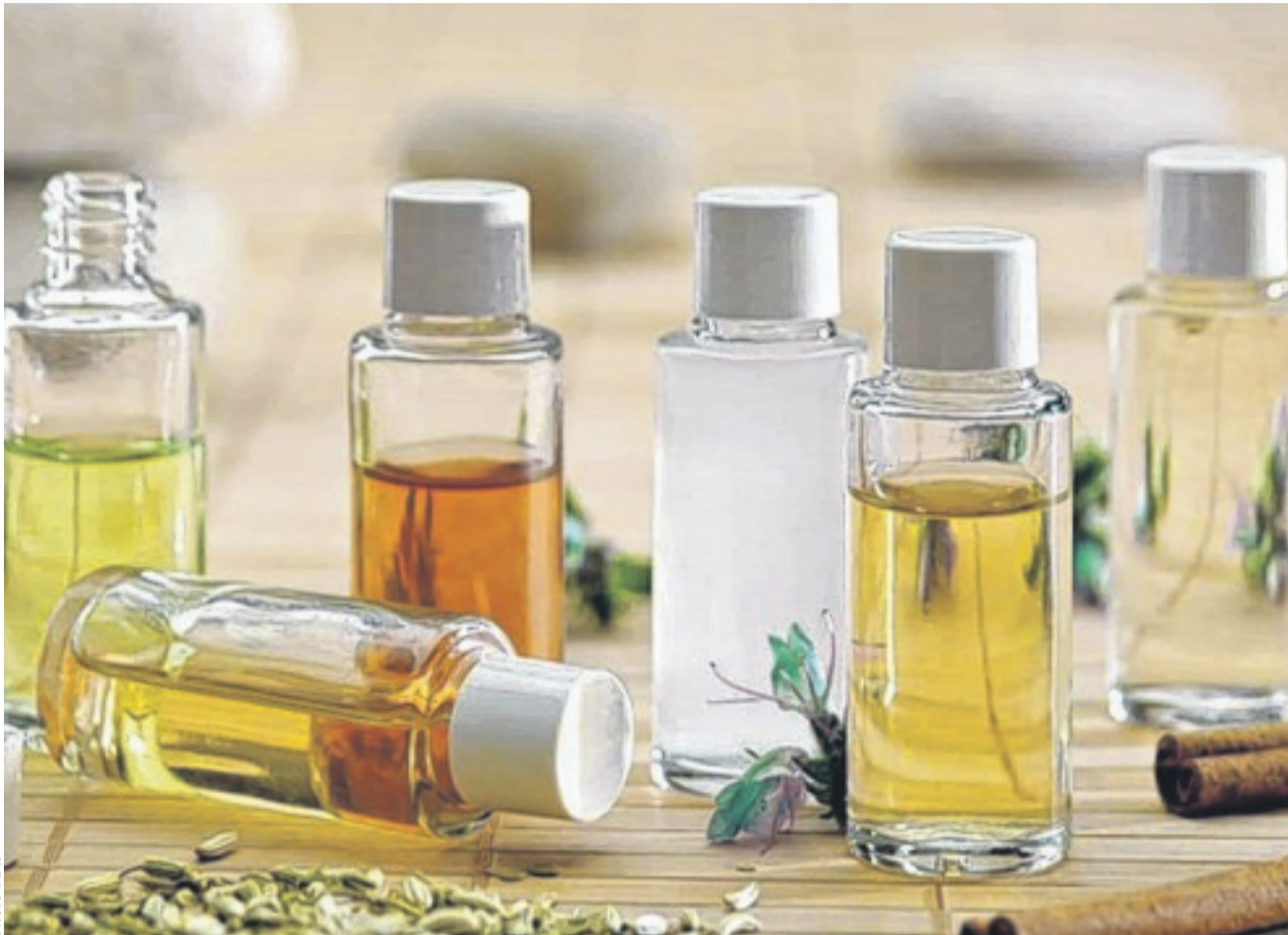
Quelques gouttes d'huiles essentielles éliminent les odeurs de cuisine dans la maison.