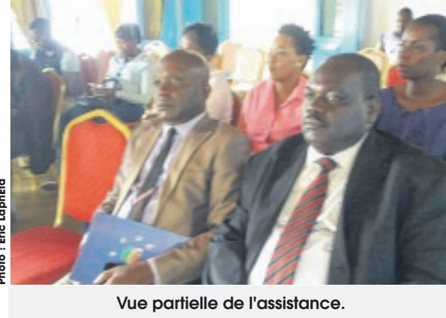
Vue partielle de l'assistance.