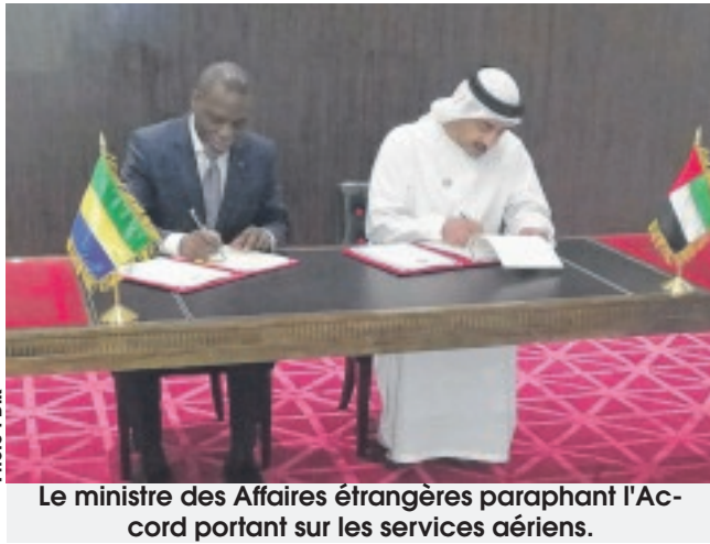
Le ministre des Affaires étrangères paraphant l'Accord portant sur les services aériens.