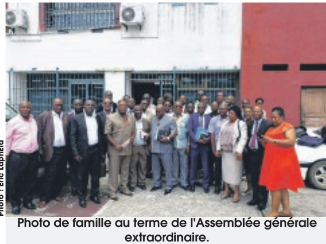
Photo de famille au terme de l'Assemblée générale extraordinaire.