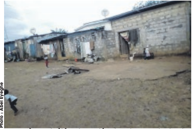
... après avoir été poignardée dans la cour du domicile de Dimitri Bessangoye.