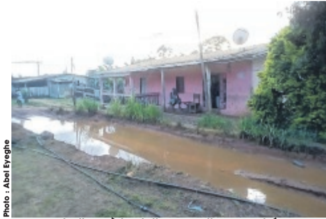
Le lieu où la victime aurait succombé à ses blessures...