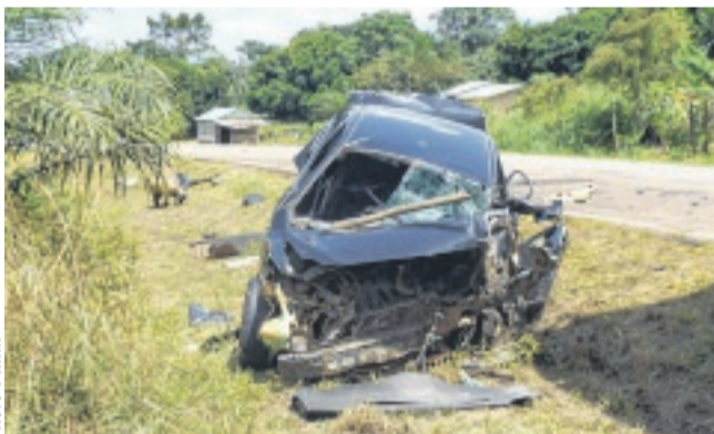
Le Toyota Corolla a été réduit en un tas de ferraille après l'accident.