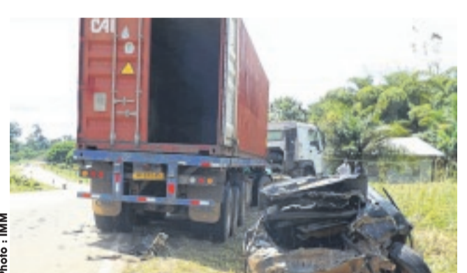
Le positionnement des deux véhicules après la collision.