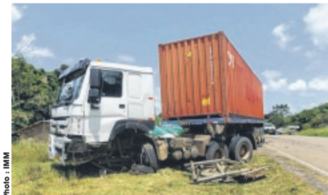
Le gros porteur a perdu, entre autres, sa roue avant.