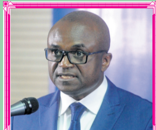
M. Francis NKEA NZIGUE

MINISTRE D'ETAT, MINISTRE DE L'EDUCATION NATIONALE :