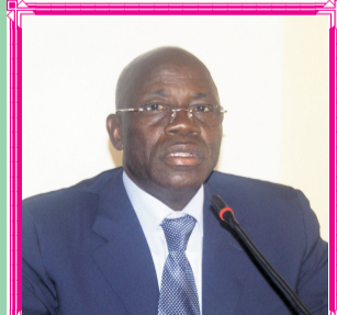
M. Michel MENGA M'ESSONE

MINISTRE D'ETAT, MINISTRE DE L'HABITAT :