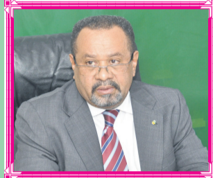
M. Guy-Bertrand MAPANGOU

MINISTRE D'ETAT, MINISTRE DE LA COMMUNICATION, PORTE-PAROLE DU GOUVERNEMENT :