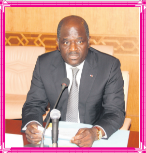
M. Régis IMMON-GAULT TATANGANI

MINISTRE D'ETAT, MINISTRE DES AFFAIRES ETRANGERES, DE LA COOPERATION, DE LA FRANCOPHONIE ET DE L'INTEGRATION REGIONALE :