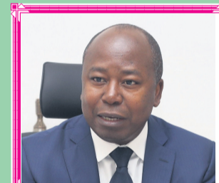
M. Alain Claude BILIE BY NZE

MINISTRE D'ETAT, MINISTRE DES SPORTS ET DE LA CULTURE, CHARGE DU TOURISME: