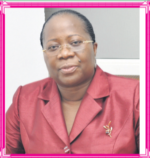
Mme Denise MEKAM'NE EDZIZIE épouse TATY

MINISTRE D'ETAT, MINISTRE DE LA SANTE ET DE LA FAMILLE