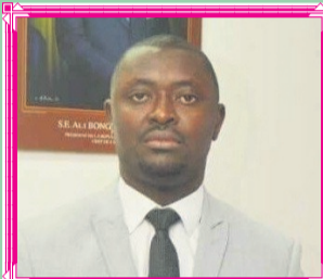
M. Justin NDOUNDANGOYE

MINISTRE DES TRANSPORTS ET DE LA LOGISTIQUE :