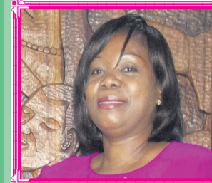
Mme Edwige BETHA ESSOUKOU

MINISTRE DELEGUE AUPRES DU MINISTRE D'ETAT, MINISTRE DE L'EDUCATION NATIONALE :