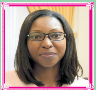
Mme Carmen NDAOT

MINISTRE DE L'INDUSTRIE ET DE L'ENTREPRENARIAT NATIONAL :