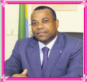
M. Julien NKOGHE BEKALE

MINISTRE DES PETITES ET MOYENNES ENTREPRISES ET DE L'ARTISANAT :