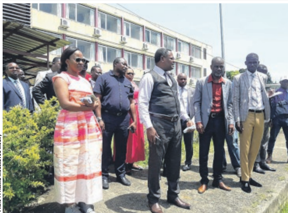
... et les pavillons de l'USS et de l'UOB.

rant universitaire. Nous allons également revoir les conditions de travail du personnel qui intervient sur ces sites. S'agissant de la question de l'insalubrité, j'ai donné des instructions au service de la maintenance, afin que les sites des campus universitaires soient restaurés dans l'immédiat», a-t-il laissé entendre.