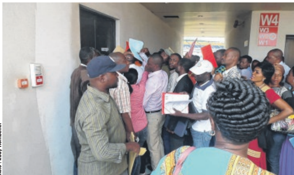
Pendant que les enseignants étaient encore à l'étape de signature des attestations spéciales de présence au poste...