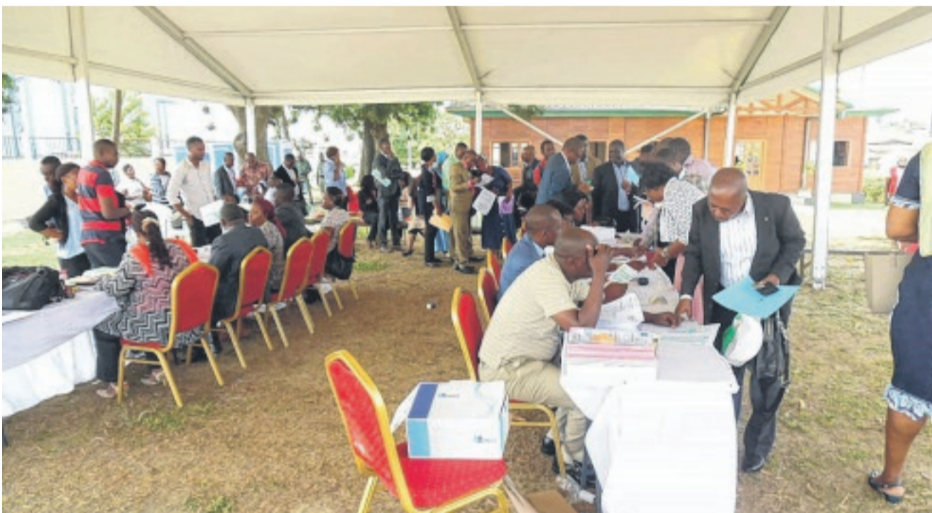
Au ministère de la Fonction publique l'opération se déroule en bon ordre.

ANNONCEE il y a quelques jours, l'opération de distribution de bons de caisse aux agents publics civils de l'Etat en poste dans la province de l'Estuaire a commencé hier matin. Les agents ont convergé vers les sites retenus en fonction des différentes administrations auxquelles ils appartiennent. C'est-à-dire, les sites du Budget, du Trésor public, de l'Économie, de la Fonction publique et du stade de l'Amitié d'Angondjé. C'est d'ailleurs à ce site qu'ont été orientés les agents des secteurs ayant les plus grands effectifs ( Santé et Éducation notamment). Pour cette première journée, plusieurs dysfonctionnements ont été dénoncés