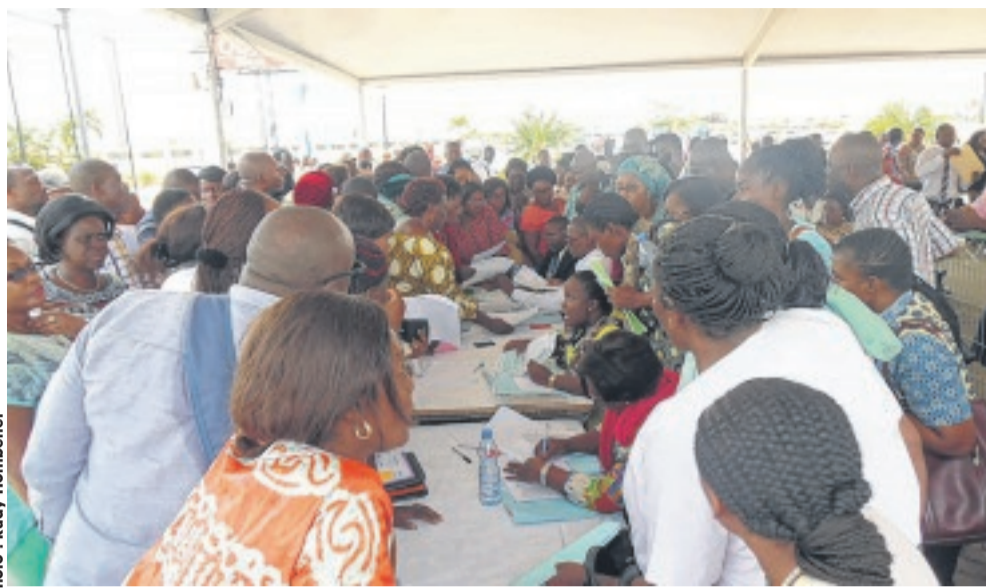
...d'autres agents essayaient en vain de retrouver leurs bons de caisse dans les sites disséminés dans la ville.