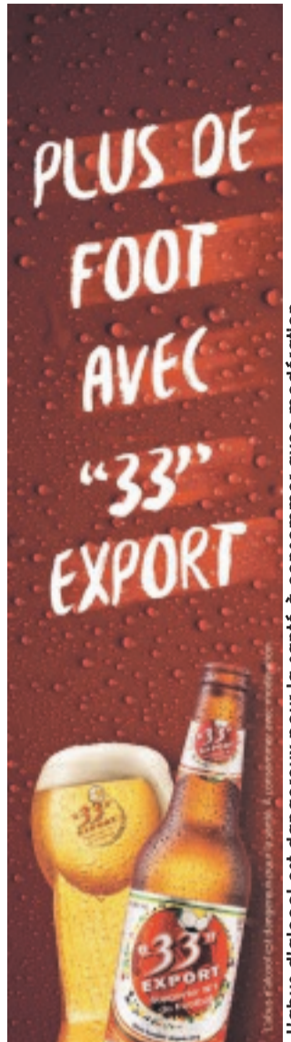
L'abus d'alcool est dangereux pour la santé à consommer avec modération