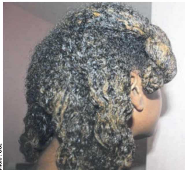
...traite aussi des problèmes liés aux cheveux.