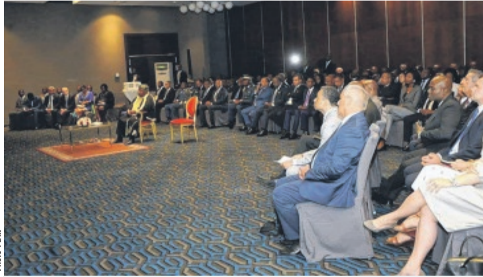
Une vue de l'assistance au cours de la cérémonie.

La certification d'un aéroport, comme l'a expliqué le DG de l'Anac, se traduit par la mise en application des dispositions de la Convention de Chicago relative à l'aviation civile internationale et des différentes annexes. En clair, a-t-il ajouté, elle manifeste notre capacité à s'adapter aux standards mondiaux et aux changements qui s'opèrent dans l'environnement de l'aéroport, et à garantir surtout la sécurité des aéronefs, des passagers, etc. "Ce processus s'inscrit en droite ligne de la politique de l'Emergence impulsée par le président de la République, mise en œuvre par le développement sécurisé