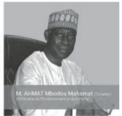
M. AHMAT Mbodou Mahamat (Tchad) CE/Ministre de l'Environnement et de la Pêche