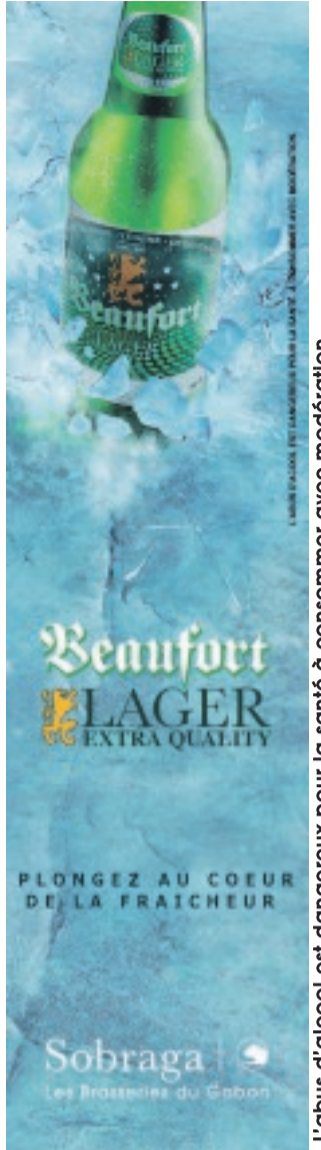
L'abus d'alcool est dangereux pour la santé à consommer avec modération