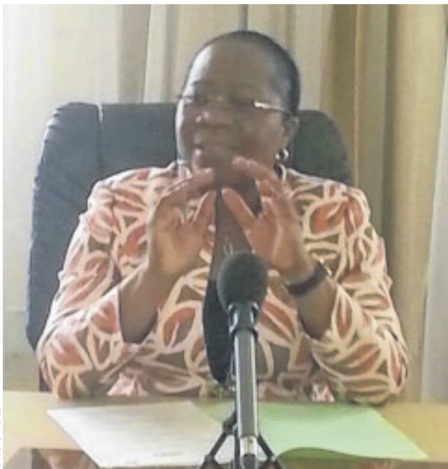
La ministre d'Etat Denise Mekam'ne au cours d'une séance de travail préparant "Octobre Rose".