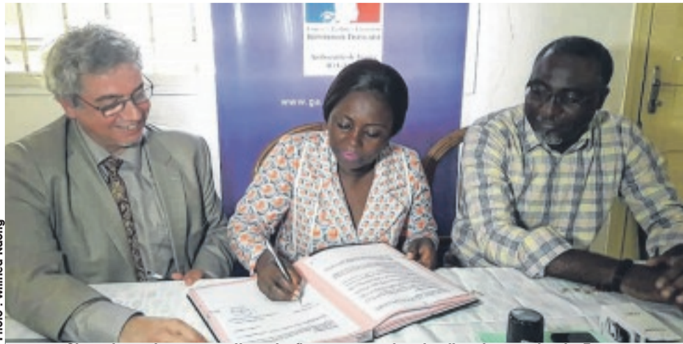
Signature de convention de financement entre l'ambassade de France et une coalition de 4 ONG.

« L'accompagnement de ce projet qui voit le jour s'appuie sur plusieurs raisons. Tout d'abord, sur le fait qu'il soit synonyme de créations d'activités génératrices de revenus pour vos adhérents, lorsqu'on connaît votre situation, à savoir des familles qui vivent avec des conjoints ou des enfants handicapés. Fort de cela, il était néces-