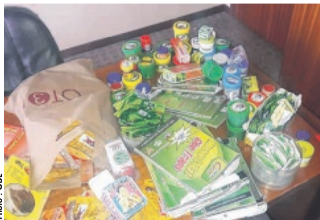
Les produits de dératisation qu'il exposait pour masquer la commercialisation...

activité principale, qui est la commercialisation illicite des produits pharmaceutiques. « Ne peuvent commercialiser les produits pharmaceutiques que les institutions compétentes en la matière. Au Gabon, elles sont bien connues, ce sont les pharmacies. Le problème avec ces produits pharmaceutiques vendus de façon illicite, c'est qu'ils ne suivent pas le circuit normal et sont mal conservés. On trouve aussi des psychotropes dans ces produits. Donc, ils échappent au contrôle de la Direction des médicaments et de la pharma-