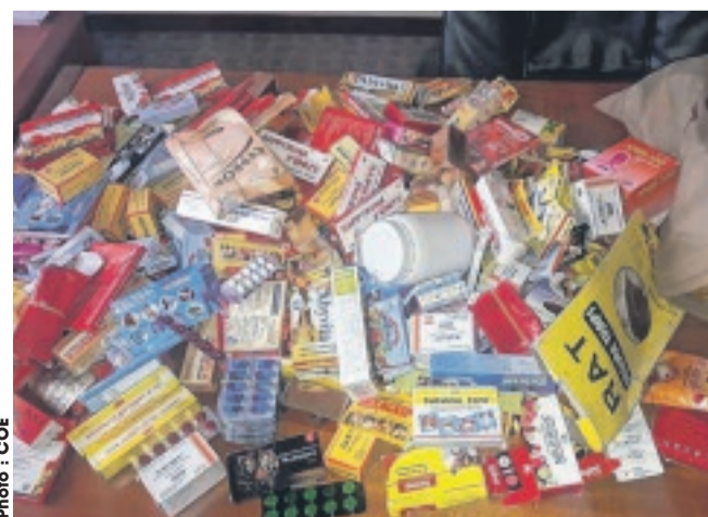
... illicite des produits pharmaceutiques.

activité principale, qui est la commercialisation illicite des produits pharmaceutiques. « Ne peuvent commercialiser les produits pharmaceutiques que les institutions compétentes en la matière. Au Gabon, elles sont bien connues, ce sont les pharmacies. Le problème avec ces produits pharmaceutiques vendus de façon illicite, c'est qu'ils ne suivent pas le circuit normal et sont mal conservés. On trouve aussi des psychotropes dans ces produits. Donc, ils échappent au contrôle de la Direction des médicaments et de la pharma-