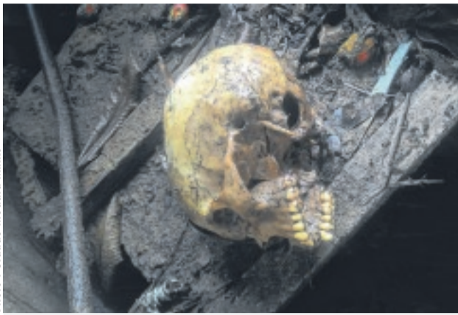
Le crâne humain retrouvé au quartier Lekoko.