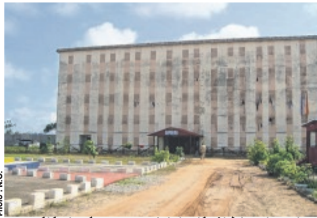
... a été placé sous mandat de dépôt à la prison de Franceville en attendant son procès.