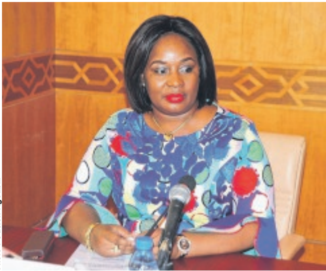
Les ministres Estelle Ondo (Industrie)...