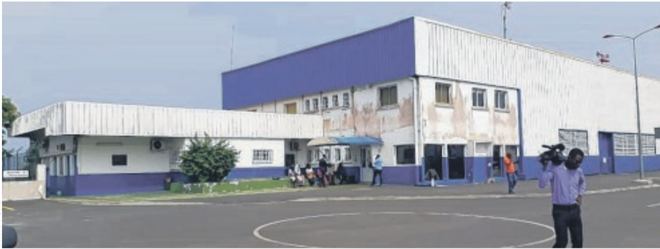
L'entreprise Héli-Union secouée par une grogne de ses agents.