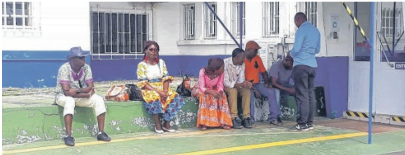
Une vue partielle des agents grévistes.

Les employés réclament le paiement de leurs avances automatiques. Une disposition, a-t-on appris, contenue dans la convention collective des sociétés aériennes dont la compagnie Héli-Union est, elle-même, signataire. En effet, selon l'article 1 de l'annexe III de cette convention, explique Gildas Mapondou Bengin, délégué du person-