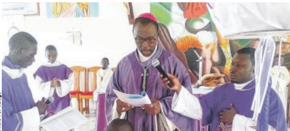
L'évêque de Port-Gentil, Mgr Eusebius Chinekezi a intronisé le nouveau curé.