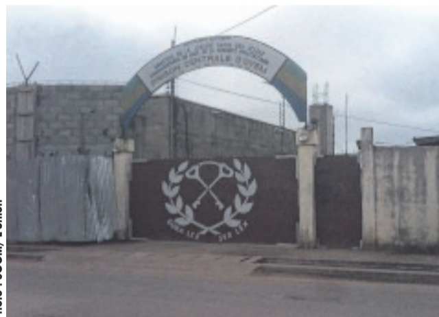
... sont désormais sous mandat de dépôt à la prison centrale d'Oyem.

dont elle a été victime, durant son absence du village. « C'est pendant que la victime se trouvait à Libreville que les malfrats ont forcé la porte de son domicile, pour s'emparer de plusieurs de