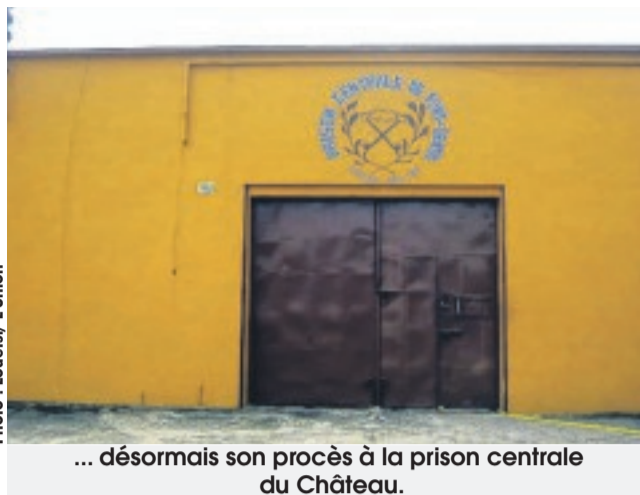
... désormais son procès à la prison centrale du Château.