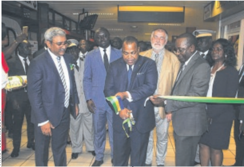
Le Premier ministre Julien Nkoghe Békale inaugure ici les nouvelles boutiques Duty Free et Relay de l'aéroport de Libreville.

En effet, depuis la reprise de la gestion de l'aéroport de Libreville il y a 7 mois, Gsez a entrepris un vaste programme d'amélioration du terminal comprenant, entre autres, la mise à disposition aux passagers d'un Wifi gratuit. D'autres travaux de rénovation sont destinés à améliorer l'infrastructure et à renforcer le système de sécurité de