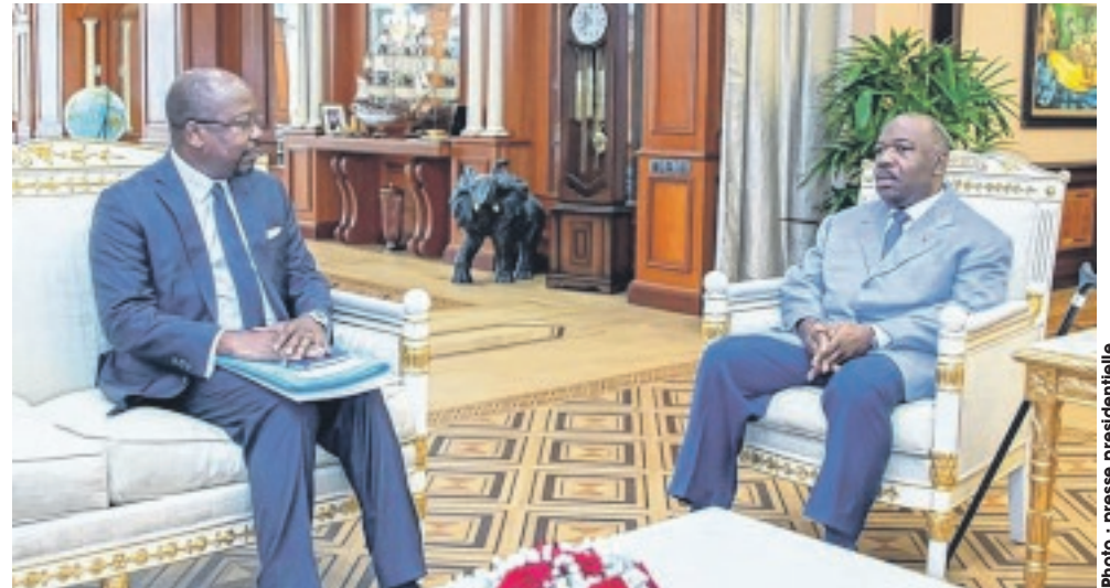
Le chef de l'État lors de l'entretien avec le ministre des Affaires étrangères.