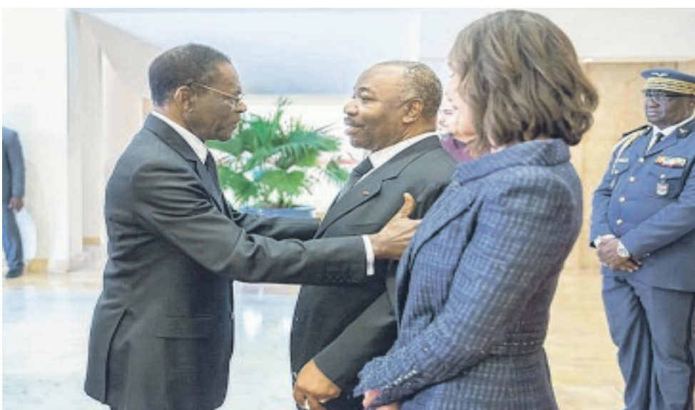
Les deux chefs de l'État lors de la dernière visite du président Obiang Nguema Mbasogo au Gabon, le mois dernier.

Au cours de cette visite, plusieurs questions d'intérêts communs devront être abordées lors de l'entretien entre les deux présidents qui aura lieu au palais de la présidence de la République. Le renforcement de la coopération entre Libreville et Malabo, la situation politique et