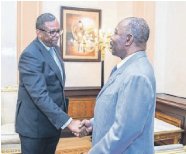
Le ministre d'État, ministre de la Justice, Edgard Anicet Mboumbou Miyakou

Par ailleurs, le chef de l'État s'est entretenu avec le ministre des Affaires étrangères, M. Alain Claude Bilie-By-Nze. Ce dernier lui a fait le compte rendu de la mission effectuée à Niamey au Niger, dans le cadre de la 12e session extraordinaire de la Conférence des chefs d'État et de gouvernement de l'Union africaine (UA). Laquelle